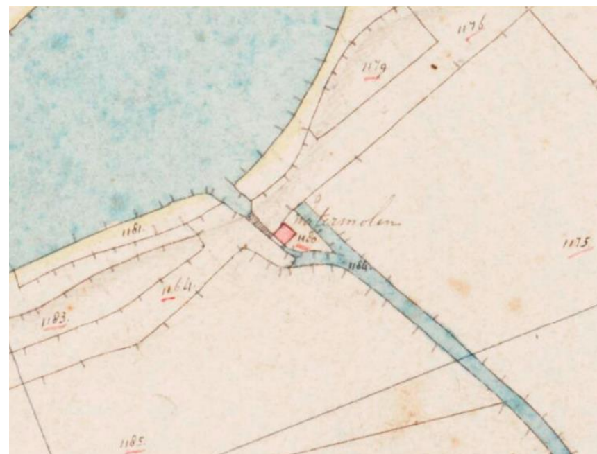
afb. 3 Gemeente Alblasterdam, kadastrale minuut 1811 – 1832, sectie B, blad 3, detail. Het vierkante vlakje op de kaart verbeeld de vorige Souburghse Molen, een wipmolen. Op dezelfde plaats verrijst in 1860 de huidige stenen molen.