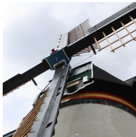
afb. 4 en 5 De baard van de Souburghse Molen