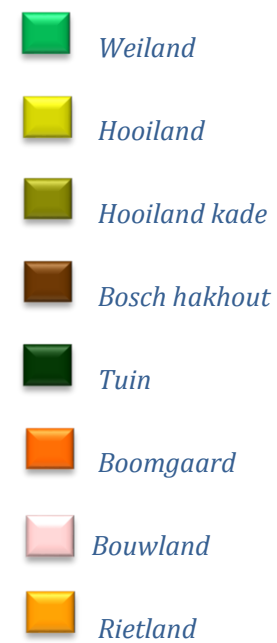
afb. 1 Kadastrale minuut 1811-1832, gemeente Alblaserdam, Sectie B, blad , detail, ingekleurd